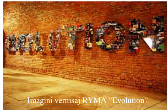
Imagini vernisaj RYMA "Evolution"